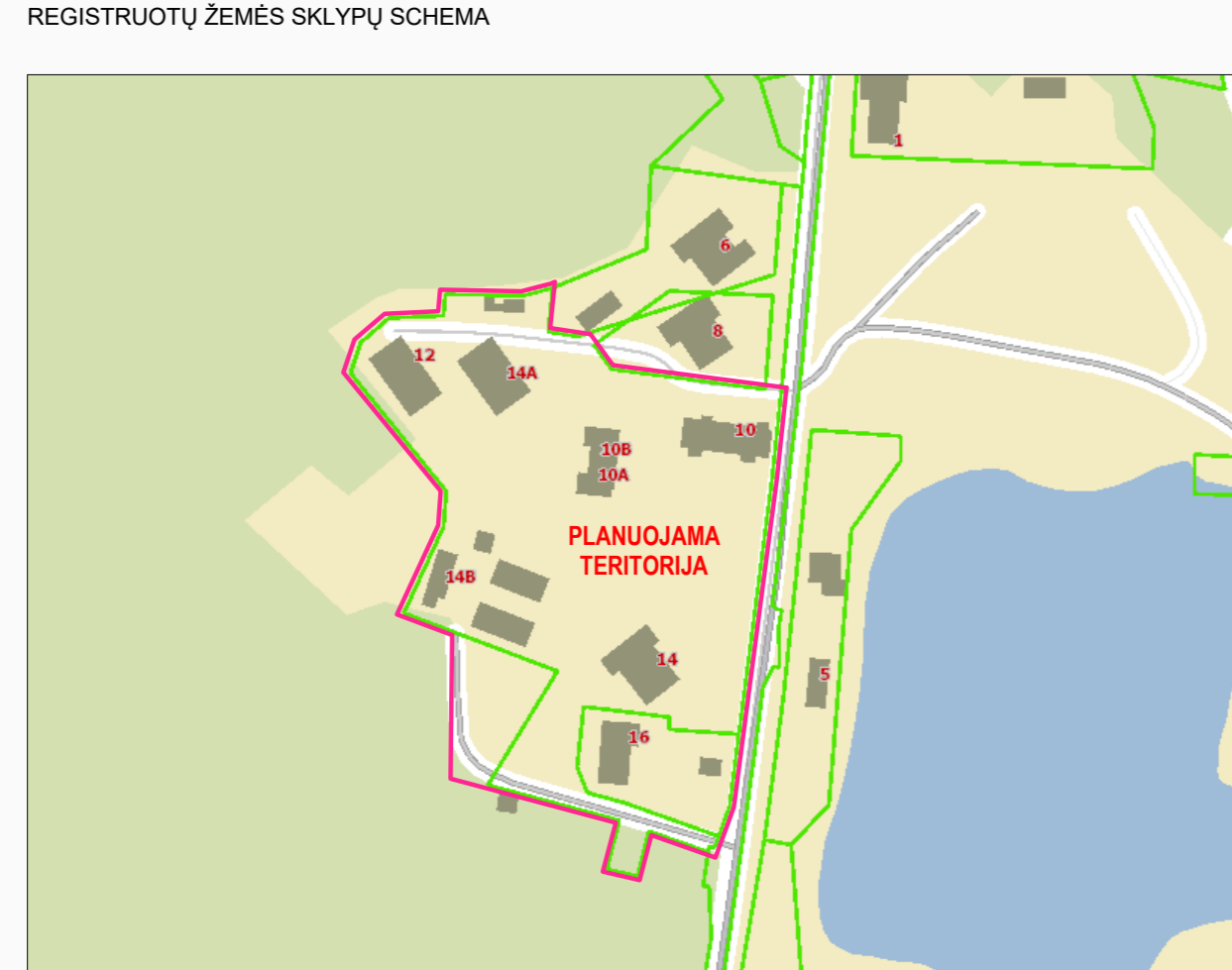
DETALIOJO PLANO TERITORIJOS NAUDOJIMO REGLAMENTŲ APRAŠOMŲI LEMELE