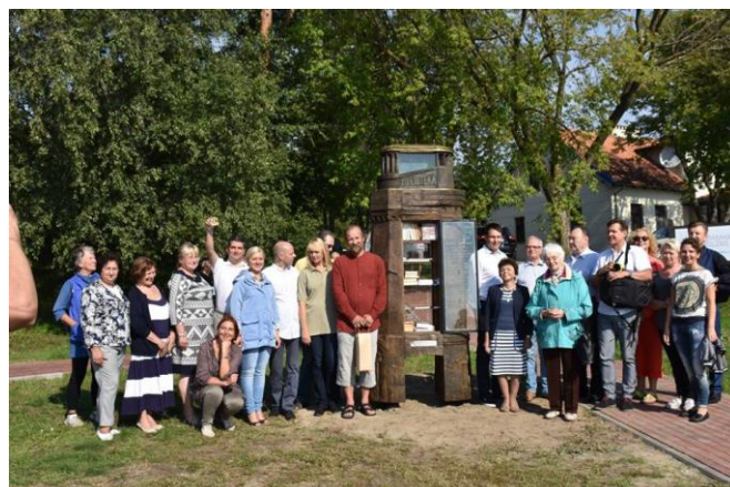
Naujovės. Nidoje ir Juodkrantėje pastatyti knygų nameliai.

Praėjusiais metais pristatytas Neringos savivaldybės biudžeto lėšomis parengtas filmas „Mano miestas - Neringa“ .