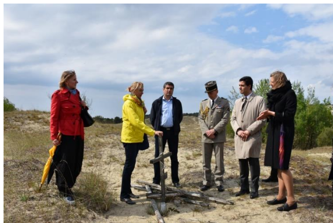
Vizitas. Prancūzijos ambasada domėjosi Mirties slėniu.