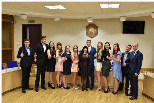
Akimirka. Savivaldybės vadovai kartu su Neringos abiturientais.

2016-aisiais Neringos socialinis paslaugų centras organizavo Trečiojo amžiaus universiteto studijas (TAU), skirtas kurorto gyventojams nuo 50 metų amžiaus. Metų pabaigoje 69 neringiškiems įteikti diplomai, liudijantys apie išklaustą dvejų metų trukmės studijų programą „Kelias į visavertį ir kokybišką gyvenimą“. Centre organizuoti visiems Neringos gyventojams skirti anglų kalbos kursai (juos lankė 22 asmenys, o mokymams skirta 5,4 tūkst. Eur.