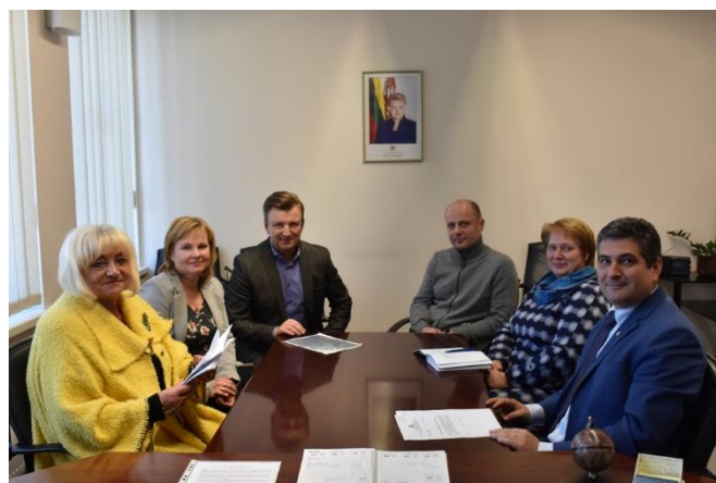
Sutartis. Neringa pradėjo bendradarbiauti su KU universiteto Tęstinių studijų institutu.

Kviečiame sekti Neringos savivaldybės naujienas – Savivaldybės internetinėje svetainėje adresu neringa.lt , Socialinio tinklo „Facebook“ Neringos savivaldybės paskyroje.