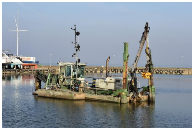
Naujovės Nidos uoste. Atstatytas projektinis gylis, padidintas švartavimosi vietų skaičius, pradėta rengti dokumentacija kuro kolonėlei.

Siekiant sudaryti palankias sąlygas vandens turizmui, atlikti Nidos kelevinio uosto akvatorijos valymo ir grunto tvarkymo darbai . Darbų metu iškasus 35000 m 3 dumblo, atstatytas projektinis uosto gylis, siekiantis 3 m. (vidutinis gylis prieš darbus siekė 1,38 m). UAB „Neringos komunalininkas“ laimėjus Klaipėdos valstybinio jūrų uosto direkcijos skelbtą pontonų nuomos konkursą, sumontuotos pontoninės prieplaukos , taip padidinant švartavimosi vietų skaičių iki 120. Praėjusiais metais taip pat pradėta rengti dokumentacija kuro kolonėlės Nidos tarptautinio kelevinio uosto prieigose įrengimui. Vandens maršrutas apjungė Juodkrantės ir Drevernos gyvenvietes .