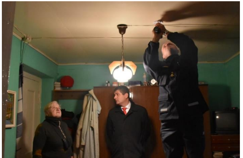
Saugumas. Gyventojams – nemokami dūmų detektoriai.

Norint paskatinti gyventojus teikti trūkstantas paslaugas, buvo taikomi sumažinti iki 1 euro fiksuoto pajamų mokesčio dydžiai būtiniausioms buitinėms paslaugoms: batų valymui, mokamų tualetų ir svėrimo veiklai, drabužių siuvimo ir taisymo, avalynės taisymo, fotografavimo veiklai, krosnių, kaminų ir židinių valymui, variklinių transporto priemonių techninei priežiūrai ir remontui, valčių, laivelių ir plaustų remontui, aplinkos