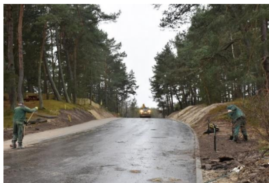
Darbai. Baigta Pervalkos gatvės rekonstrukcija.

Tvarkomos gatvės. Praėjusiais metais naujas dviračių ir pėsčiųjų takas , pritaikytas ir žmonėms su judėjimo negalia, sujungė Skruzdynės gatvę ir Kuršių marias (Lietuvos automobilių kelių direkcijos lėšos). Parengus reikiamą dokumentaciją pradėti dalies Žaliojo kelio tvarkybos darbai . Jų metu bus rekonstruota 1.20 kilometro neasfaltuoto kelio ruožo, kuris tęsiasi iki krašto kelio Nida-Smiltynė (darbus planuojama baigti 2017 m. II ketvirtį). Atliktas Pamario gatvės važiuojamosios dalies ruožo, esamos automobilių stovėjimo aikštelės ir pėsčiųjų tako ruožo kapitalinis remontas (greta Thomo Manno memorialinio muziejaus) . Įgyvendintas Pervalkos gatvės rekonstrukcijos II etapas . Jo metu rekonstruota Pervalkos gatvės dalis, esanti dešinėje pusėje nuo įvažiavimo į gyvenvietę, taip pratęsiant darbus, atliktus 2013-aisiais.