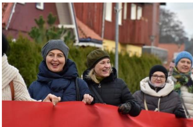
Statistika. Neringoje – daugiausiai darbingo amžiaus žmonių.

Savaitraščio „Veidas“ sudarytame 2016-ųjų metų Savivaldybių reitinge Neringa užėmė 1-ąją vietą. Vertinant 22 statistinius kriterijus daugiausiai dėmesio buvo teikiama ekonominiams kriterijams. Įvertinta tai, kad per metus Neringoje labiausiai padaugėjo gyventojų (2,3 proc.), čia buvo mažiausias nedarbas visoje Lietuvoje, taip pat veikė daugiausiai ūkio subjektų, tenkančių tūkstančiui žmonių, gyveno mažiausiai socialines pašalpas gaunančių gyventojų ir socialinės rizikos šeimų bei daugiausiai darbingo amžiaus žmonių Lietuvoje.