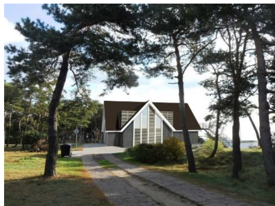
Planai. Parengtas sporto mokyklos pastato rekonstrukcijos techninis projektas.

2016-aisiais atlikti veiksmai siekiant modernizuoti ir į naują vietą iškelti Nidos kontrolės postą , kuriame renkama vietinė rinkliava už įvažiavimą į Neringą. Šis postas šiuo metu yra Nidos