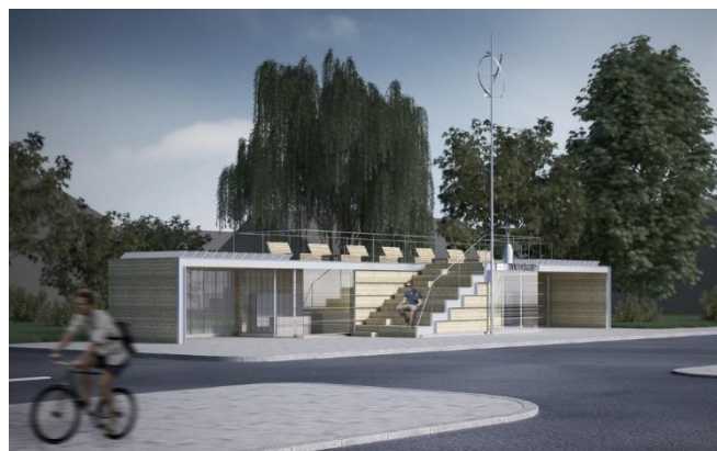
Pokyčiai. Juodkrantės autobusų stotelė bus iškelta į naują vietą.