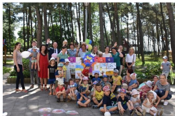
Šventės. Minėta Tarptautinė vaikų diena.