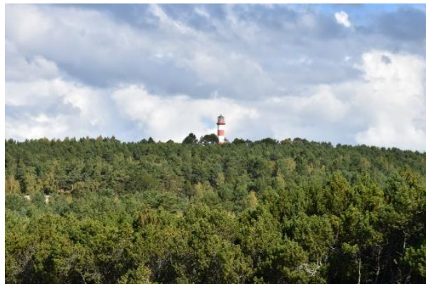
ES lėšos. Savivaldybė sieks sutvarkyti Urbo kalną

Praėjusiais metais Neringos savivaldybė pradėjo veiksmus, kuriais siekiama sutvarkyti Nidoje esantį Urbo kalną . Urbo kalno tvarkybos darbais būtų sprendžiamos esamos problemos – atnaujinama ir vystoma takų infrastruktūra, apšvietimas. Pašalinus menkaverčius medžius ir krūmus, pasenusius kalnapušynus norima įrengti apžvalgos aikšteles Nidos panoramoms apžvelgti, tvarkyti mažąją architektūrą. Puoselėjami planai pagal galimybes atkuri istorinius želdinius, nustatyti ir pažymėti senojo švyturio vietą bei įprasminti senąjį, akmenimis grįsta taką. Planuojama, kad projekto įgyvendinimui bus panaudotos Europos Sąjungos lėšos.