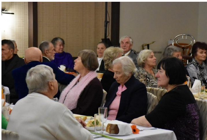
Tradicijos. Senjorams – Tarptautinės pagyvenusių žmonių dienos iškilms.

2016-aisiais didesnis dėmesys skirtas paslaugų prieinamumui vaikus globojančioms šeimoms, globėjams (rūpintojams), tėvams ir šeimynų dalyviams ar besirengiantiems jais tapti asmenims (mokymams, konsultacijoms, viešinio renginiais panaudota 9,5 tūkst. Eur.).