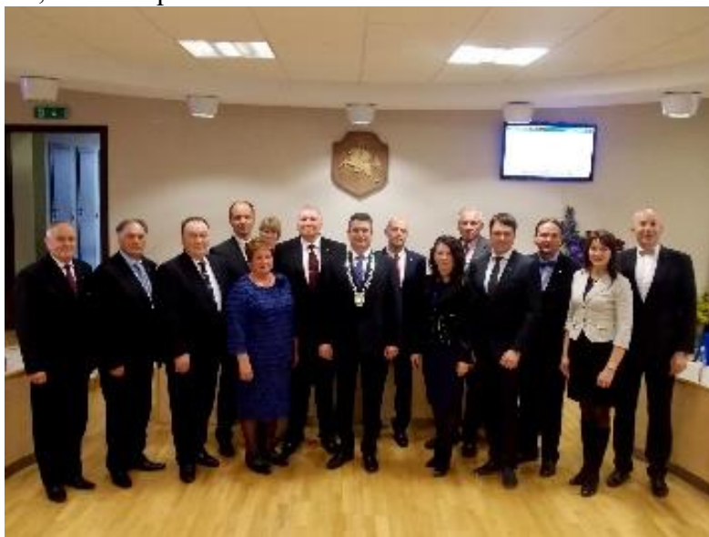
Pokyčiai: Darbą pradėjo 2015–2019 metų kadencijos Neringos savivaldybės taryba