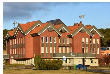
Uždaviniai. Patikslintas pajamų planas įvykdytas 101,8 proc.

Šiuo metu Neringos savivaldybė ruošiasi naujam Europos sąjungos finansavimo periodui (2014-2020 metų laikotarpiui). Jau yra numatyta 10 projektų, kurių įgyvendinimui Neringos savivaldybė sieks gauti Europos Sąjungos paramą.