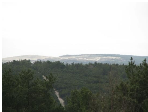
Žalioji skraistė. Miškai perduoti valdyti Kretingos miškų urėdijai

turto mokestis, siekiantis 3 procentus. Praėjusiais metais 17 statinių pripažinti bešeimininkiais – teismo sprendimu jie perduoti Neringos savivaldybei. Tai suteikia galimybę šiuo statinius ar teritorijas aplink juos sutvarkyti.