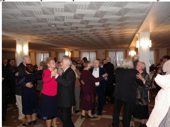
Tradicija. Senjorams organizuotas šventinis vakaras Tarptautinės pagyvenusių žmonių šventės proga

Dėmesys žmogui – visuomenės poreikį tenkinanti socialinės paramos sistema. Pagrindinis veiksnys, lemiantis socialinių paslaugų reikalingumą, yra senėjantis Neringos savivaldybėje gyvenančių žmonių amžius ir su tuo susijusių problemų sprendimas.