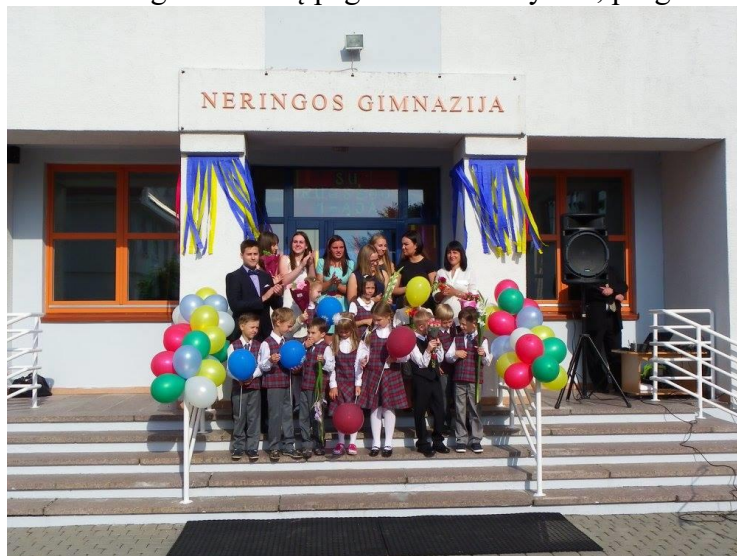
Mokslo metai: Neringos vidurinė mokykla naujus mokslo metus pradėjo kaip Neringos gimnazija

Didžiausia naujovė kurorto švietimo srityje praėjusiais metais – Neringos vidurinė mokykla naujus mokslo metus pradėjo kaip Neringos gimnazija, vykdanči pradinio, pagrindinio ir akredituotas vidurinio ugdymo programas. Mokykla turėjo būti pertvarkyta įgyvendinat Švietimo įstatymo nuostatas, numačiusias, kad nuo 2015-ųjų rugsėjo 1-osios šalyje turi nelikti vidurinių mokyklų. Jos turi būti reorganizuotos į pagrindines mokyklas, progimnazijas arba gimnazijas.