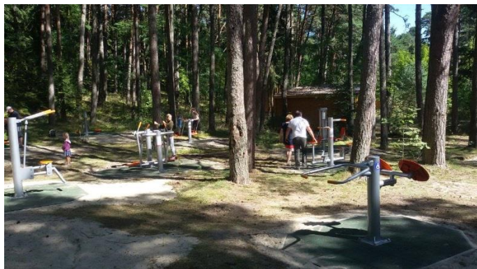
Laisvalaikis. Atsižvelgiant į gyventojų nuomonę, Nidoje ir Juodkrantėje įrengti lauko treniruoklių kompleksai

Puikios sąlygos aktyviam laisvalaikiui. Neringoje – puikios sąlygos jaunimo ir suaugusiųjų sporto bei sveikatinimo veiklai. Siekiant užtikrinti dar didesnę aktyvaus laisvalaikio įvairovę, 2015-aisiais metais įgyvendintos priemonės, padedančios vystyti sporto infrastruktūrą, remiančios įvairias veiklas.