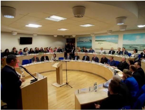
Viešumas: tiesioginės posėdžių transliacijos

Tarybos sudarytų komisijų. Į jų sudėtį yra įtraukiami ne tik savivaldybės tarybos nariai, bet ir savivaldybės administracijos darbuotojai, kitų savivaldybės įstaigų atstovai, kurorto gyventojai. Tarybos sudarytos komisijos: Administracinė komisija, Administracinių ginčų komisija, Antikorupcijos komisija, Etikos komisija, Peticijų komisija, Savivaldybės švaros ir tvarkos priežiūros komisija, Paramos teikimo išimties tvarka komisija, Komisija laisvės kovoms įamžinti, Narkotikų kontrolės komisija, Nevyriausybiinių organizacijų taryba, Jaunimo reikalų taryba, Viešųjų darbų komisija, Vietos bendruomenės taryba, Komisija Neringos savivaldybės tarybos veiklos reglamentui rengti ir keisti, Privatizavimo komisija.