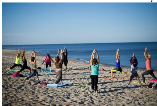
Tęstinumas. Vasarą Nidos ir Juodkrantės paplūdimiuose - jogos užsiėmimai.

Nuo praėjusių metų judėjimo negalią turintiems žmonėms suteikiama galimybė pasiekti jūrą specialiu vežimėliu , kuriuo vasaros metu galima pasinaudoti Nidos centriniame paplūdimyje.