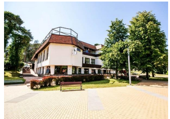
Investicijos. Pristatytas atnaujintas legendinio restorano „Nida“ pastatas

Taip pat parengtas Nidos pagrindinio pajūrio aptarnavimo centro teritorijos bei jos artimos aplinkos detalusis planas ( Jūros terapijos centro ) bei Kuršių buities muziejaus techninis projektas.