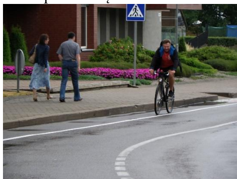
Saugumas. Nidoje išskirta 7610 metrų eismo juostų dviratininkams

2015-aisiais inventorizuota Juodkrantės krantinė, uostas ir siekiama iki laivų plaukiojimo sezono pradžios įteisinti šiuos statinius nuosavybės teise.