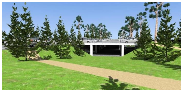
Pasiekimas. Sudarytos galimybės dviejų aukštų automobilių saugykloms įrengti

Praėjusiais metais įvykdyta daugiau patikrinimų, skirtų palaikyti tvarką automobilių stovėjimo aikštelėse, kuriose yra Kelio ženklas Nr. 531 „Rezervuota stovėjimo vieta“. Iš viso per 2015-uosius surašyti 170 administracinės teisės pažeidimo protokolai su administraciniais nurodymais, priimti 30 nutarimai. Didžioji dalis administracinės teisės pažeidimų padaryta automobilių parkavimo srityje, pažeidžiant ženklą Nr. 531 „Rezervuota stovėjimo vieta“.