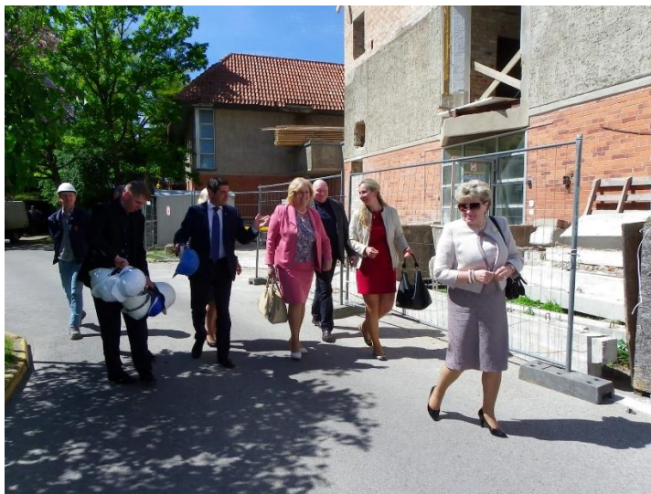
Rekonstrukcija. Su Pirminės sveikatos priežiūros centro rekonstrukcijos eiga susipažino Sveikatos apsaugos ministrė R. Šalaševičiūtė.

Iš Savivaldybės biudžeto Neringos pirminės sveikatos priežiūros centrui skirta 62,4 tūkst. Eur, iš jų – greitosios medicinos pagalbos posto Juodkrantėje veiklos užtikrinimui 7,2 tūkst. Eur; atnaujinta esamų automobilių medicininė įranga, tam skirta 29,6 tūkst. Eur; iš dalies finansuotas gydytojo odontologo atlyginimas – 3,6 tūkst. Eur; slaugos ir palaikomojo gydymo stacionarių paslaugų plėtrai, kokybės gerinimui skirta 17,4 tūkst. Eur. Praėjusiais metais buvo tęsiami Neringos pirminės sveikatos priežiūros centro pastato rekonstrukcijos darbai, kuriuos atliekant panaudota 453,6 tūkst. Eur valstybės investicijų programos lėšų.