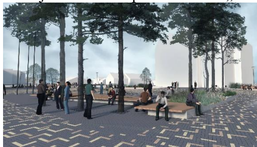
Viešumas. Pristatytas Nidos visuomeninio centro dalies sutvarkymo projektas

Ypatingas dėmesys šiuo metu skiriamas kurorto viešųjų erdvių tvarkymui bei tam reikalingos dokumentacijos rengimui. Kuršių nerijos kraštovaizdžiui reikšmingi projektai pristatomi Neringos architektūros, urbanistikos ir kraštovaizdžio architektų tarybai. Šiai tarybai bei kurorto bendruomenei 2015-aisiais pristatytas ir Nidos visuomeninio centro dalies su prieigomis, formuojant centrinę miesto aikštę, kompleksinio sutvarkymo techninis projektas , kurio pagrindu bus tvarkoma gyvenvietės teritorija nuo skvero prie restorano „Nida“ iki Neringos savivaldybės pastato ir aplink.