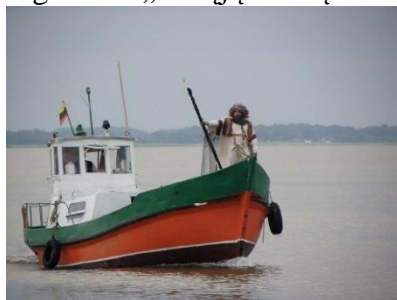
Parama. Neringoje vykstantiems renginiams – AB „Swedbank“ parama.

Praėjusiais metais paramos sutartį sudarė Neringos savivaldybės administracija ir AB „Swedbank“. Pagal šią sutartį parama buvo suteikta trimis renginiams: festivaliui „Baltic voice“, renginiams „Senujų amatų dienos Neringoje“ bei „Pamario krašto žvejo šventė“. Šia sutartimi AB