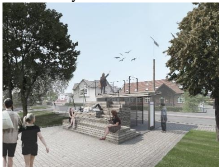
Sustojimai. Neringos autobusų stotelėms - unikalūs sprendimai

turto mokestis, siekiantis 3 procentus. Praėjusiais metais 17 statinių pripažinti bešeimininkiais – teismo sprendimu jie perduoti Neringos savivaldybei. Tai suteikia galimybę šiuo statinius ar teritorijas aplink juos sutvarkyti.