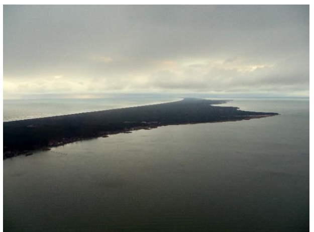
Procedūros: Naujos statybos Aplinkos ministrui pritarus

Neringos savivaldybė iniciavo Lietuvos Respublikos kelių priežiūros ir plėtros programos finansavimo įstatymo pakeitimus, kuriais būtų numatyta, kad keliantis keltais per Klaipėdos valstybinio jūrų uosto akvatoriją į Kuršių neriją ar iš jos bilieto kaina būtų kompensuojama Neringos mieste ir Klaipėdos miesto dalyje