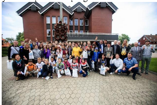
Padėka. Už vaikų iš Ukrainos priėmimą Neringos savivaldybė gavo šios šalies ministerijos padėką

nominacijai gauti teikė Neringos savivaldybė ir jai pavaldžios įstaigos bei kasmetinių kurorte vykstančių festivalių organizatoriai.