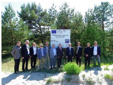
Domėjosi problemomis. Neringoje Lankėsi Seimo Jūrinių ir žuvininkystės reikalų komisija.

Neringos iniciatyvoms – šalies vadovų dėmesys ir verslo parama. Neringoje 2015-aisiais