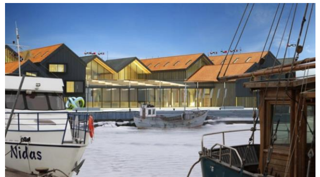
Planai. Buvusio žuvininkystės ūkio vietoje numatomas 5 žvaigždučių viešbutis