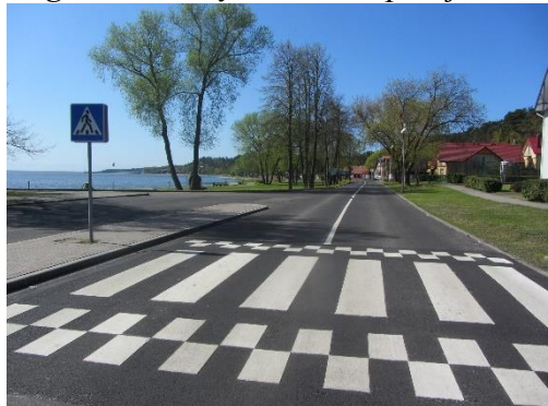
Pokyčiai. Atlikti L. Rėzos gatvės paprastojo remonto darbai

Įsiklausant į Juodkrantės gyventojų pageidavimus, autobusų sustojime ties Gintaro įlanka įrengta autobusų stotelė bei perėja.