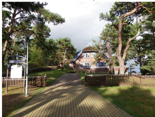
Reorganizacija. Priimtas sprendimas Neringos istorijos muziejų prijungti prie Thomo Manno memorialinio muziejaus.