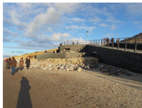
Žvejyba. Baltijos jūros pakrantėje įrengta laivų ištraukimo/įtraukimo įranga

Nidos kultūros ir turizmo informacijos centre „Agila“ įrengtas nuomos punktas su žieminei žvejybai reikalingu inventoriumi .